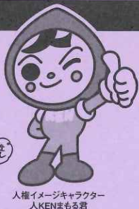
人権イメージキャラクター 人KENまる君

後援(予定)：岐阜県教育委員会、中日新聞社、岐阜新聞社・岐阜放送、NHK岐阜放送局、FC岐阜