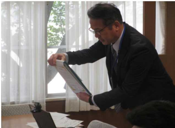
指定書をオンラインで校内に配信（校長）