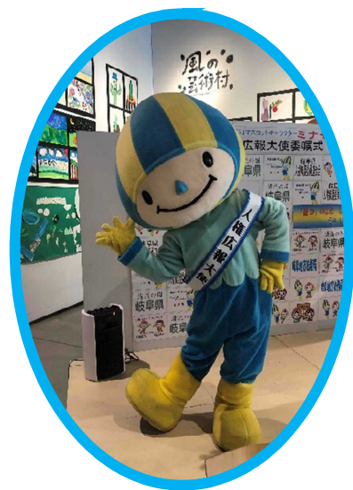
人権広報大使のたすきを かけてポーズを決めるミナモ

委嘱式では、岐阜地方法務局長から委嘱状が、岐阜県人権擁護委員連合会長から人権広報大使のたすきがミナモに渡されました。