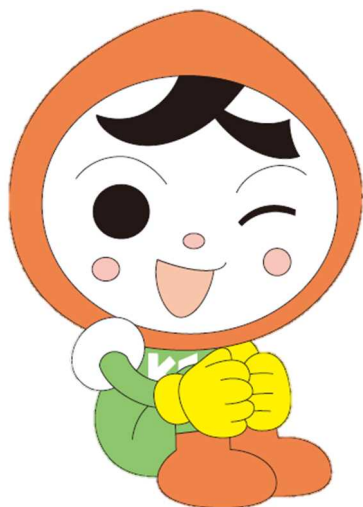
人権イメージキャラクター 人KEN まもる君