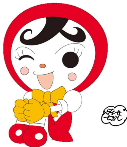
人権イメージキャラクター 人KEN あゆみちゃん