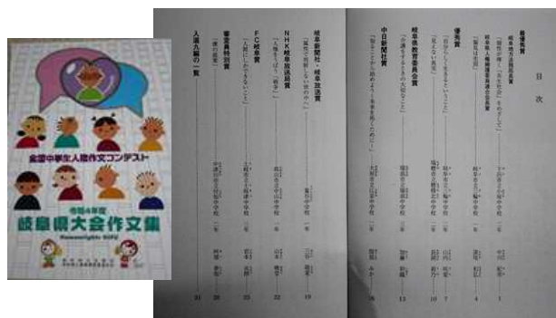
配布された「同コンテスト岐阜県大会作文集」と「全国中学生人権作文コンテスト入賞作文集」