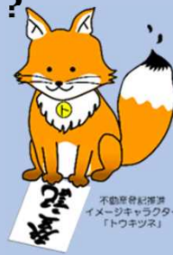
不動産登記簿簿 イメージキャラクター 「トウキツネ」