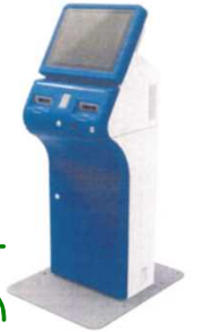
証明書発行請求機

（※）地図等証明書は須賀川証明サービスセンター と南相馬証明サービスセンターのみのお取扱い となります。