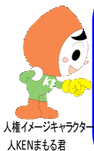
人権イメージキャラクター 人KENまる君