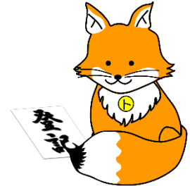
不動産登記推進イメージキャラクター 「トウキツネ」

TEL : 0776-22-5090 FAX : 0776-28-7118 Mail : soumu01_fukui@moj.go.jp