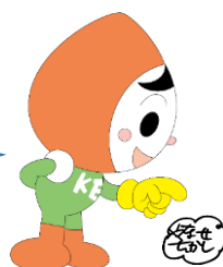
人KENまもる君 人権イメージキャラクター