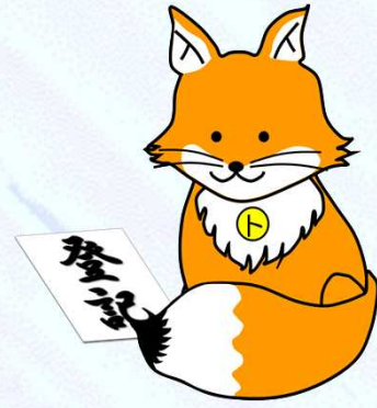
不動産登記推進イメージキャラクター 「トウキツネ」

青森地方法務局では、令和6年4月1日からスタートした「相続登記の申請義務化」などの新たな制度を多くの皆様に知っていただくために、県民の皆様からのご依頼により、法務局職員を派遣し、出前講座を行っています。