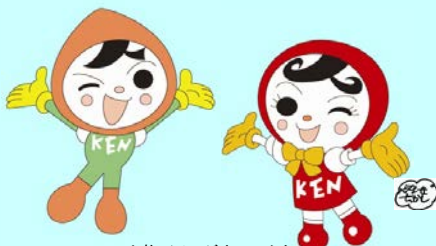
人権イメージキャラクター