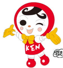
人権イメージキャラクター 人KENあゆみちゃん