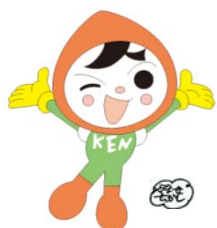
人権イメージキャラクター 人KENまるも君

日常生活の様々な心配ごと、困りごとについての「法務局休日相談所」を開設します。 また、当日は「知って役立つ講演会」も実施いたしますので、お気軽にお越しください。