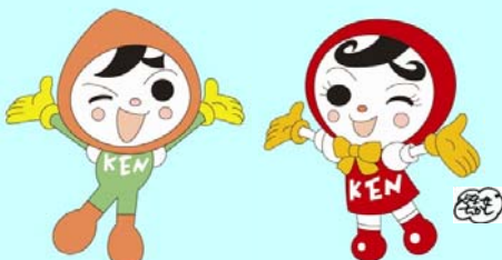
人権イメージキャラクター 人KENまるる君