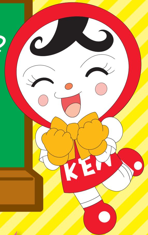
人権イメージキャラクター 人KENあゆみちゃん