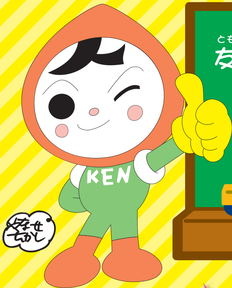
人権イメージキャラクター 人KENまもる君