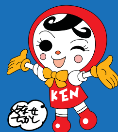
人権イメージキャラクター 人KENあゆみちゃん