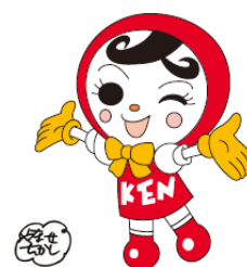
人権イメージキャラクター 人KEN あゆみちゃん