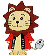
大阪法務局オンライン利用促進 イメージキャラクター おんらいおん君

★相談は予約優先制です。ただし、法テラス契約弁護士による一般法律相談について、本局は先着16名、堺支局は先着8名の完全予約制となります。