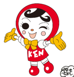
人権イメージキャラクター 人KEN あゆみちゃん