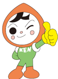
人権イメージキャラクター 人KEN まもる君