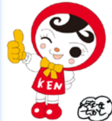
人権イメージキャラクター 人KENあゆみちゃん

令和元年10月6日(日) 名古屋法務局(本局)において、 以下のイベントを 同時開催 します!