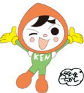
人権イメージキャラクター 人KENまもる君

令和元年10月6日(日) 名古屋法務局(本局)において、 以下のイベントを 同時開催 します!