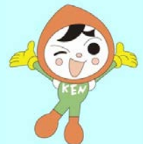
人権イメージキャラクタ