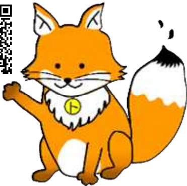
不動産登記推進 イメージキャラクター 「トウキツネ」