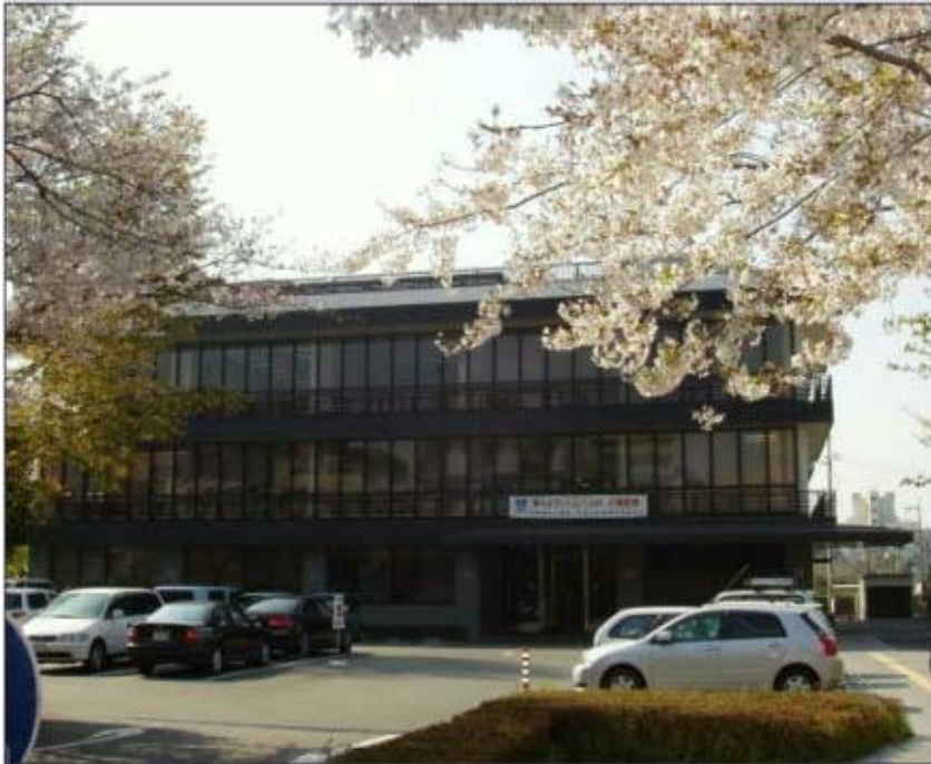
京都地方法務局本局（上京区）