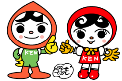
人権イメージキャラクター 人KENまもる君・人KENあゆみちゃん

小学生、中学生やその保護者の方々に、身近にある法務局を知 っていただくために「見学会」を開催します。