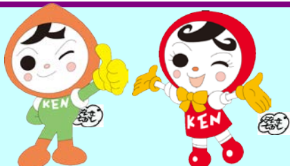
人権イメージキャラクター 人KENまるる君