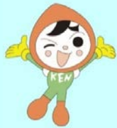
人権イメージキャラクター 人KENまる君