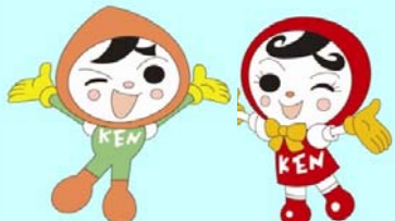
人権イメージキャラクター 人KENまもる君 人KENあゆみちゃん

【予約・お問い合わせはこちらまで】 岐阜地方法務局総務課 電話058-245-3181(内線116) ☆9月6日(木)から予約受付開始(土・日・祝日を除く) HP http://houmukyoku.moj.go.jp/gifu/