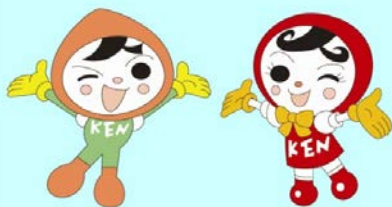
人権イメージキャラクター 人KENまもる君 人KENあゆみちゃん