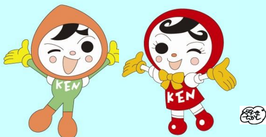
人権イメージキャラクター 人KENまもる君

http://houmukyoku.moj.go.jp/homu/static/