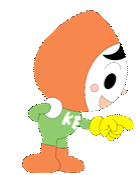
人権イメージキャラクター 人KENまる君