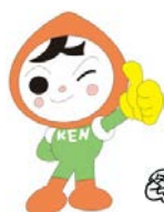
人権イメージキャラクター 人KENまる君